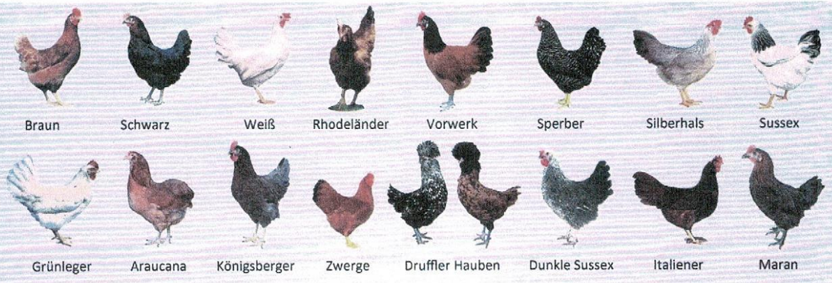
Braun Schwarz Weiß Rhodeländer Vorwerk Sperber Silberhals Sussex Grünleger Araucana Königsberger Zwerge Druffler Hauben Dunkle Sussex Italiener Maran

Alle Elterntiere und Endprodukte sind ihren speziellen Anforderungen entsprechend schutzgeimpft und stehen unter ständiger, fachärztlicher Betreuung. Solange der Vorrat reicht. Nachdruck - auch auszugsweise - verboten!